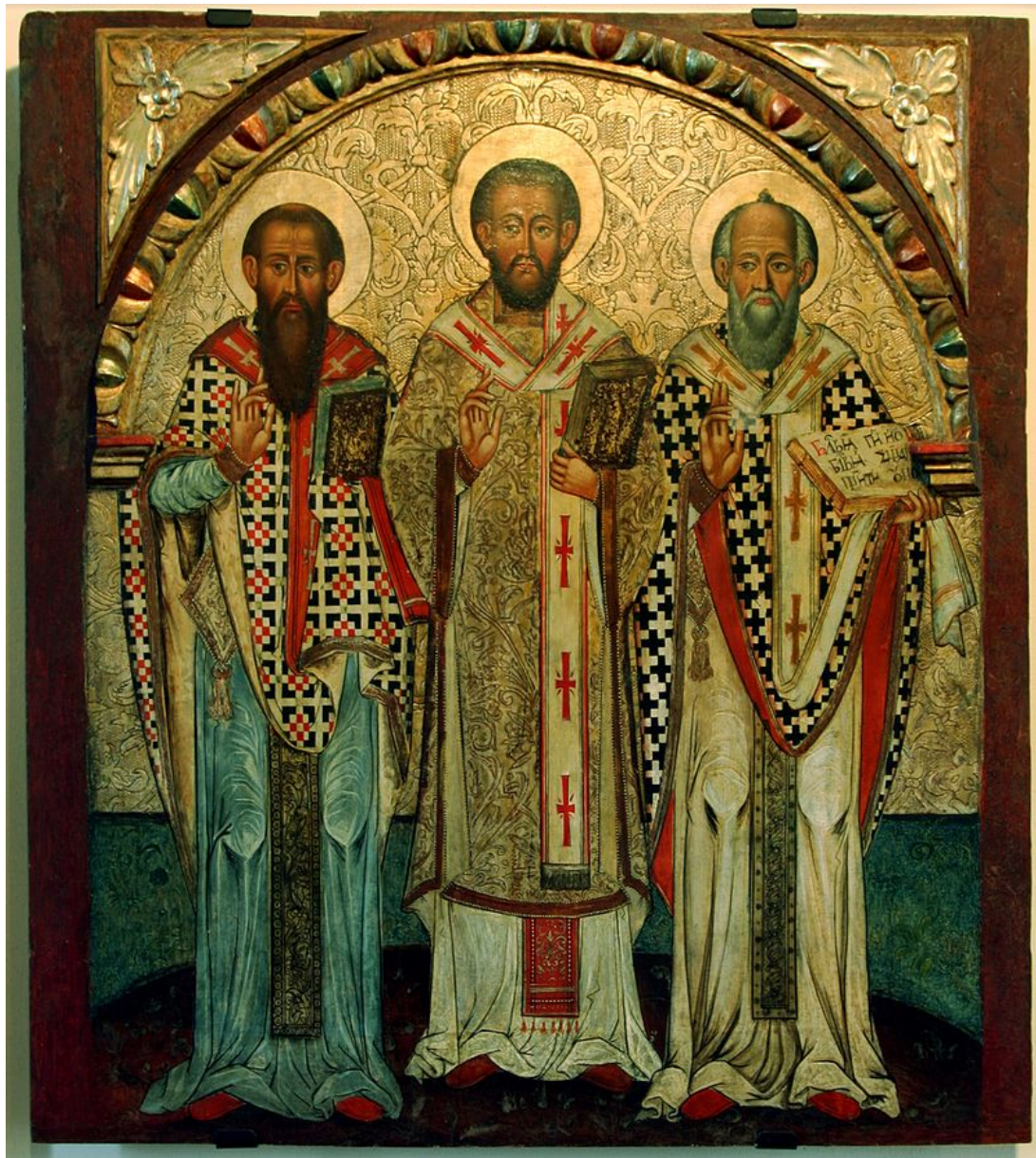
三成聖者、左から聖大ワシリイ、金口イオアン、神学者グリゴリイ